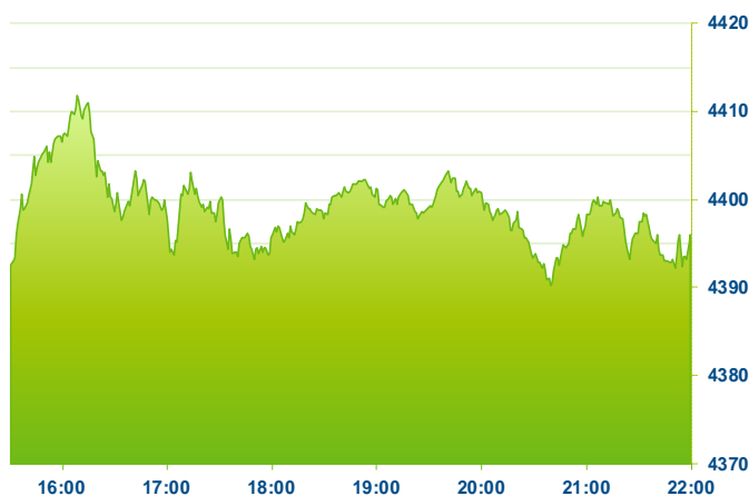
S&P 500 (předchozí den)

Změna kursu futures na americké indexy se počítá vzhledem k poslednímu vypořádání předchozího dne v 22:15. Změna kursu futures na DAX a Euro Stoxx 50 se počítá vzhledem k 22:30 předchozího dne. Změna kursu japonského indexu Nikkei 225 se počítá vzhledem k uzavření předchozího dne v 7:10. Změna kursu čínského Shanghai Composite se počítá vzhledem k uzavření předchozího dne v 08:00. Změna kursu hongkongského Hang Sengu se počítá vzhledem k uzavření předchozího dne v 9:20. Do této doby se index také obchoduje, uvedená hodnota tedy není závěr dnešního dne, ale poslední zachycený kurs v probíhajícím obchodování. Změna kursu měnových párů se počítá vzhledem k 22:50 předchozího dne. Změna kursu komodit se počítá vzhledem ke kursu v 23:45 předchozího dne. Uvedené časy jsou v středoevropském čase (SEČ).