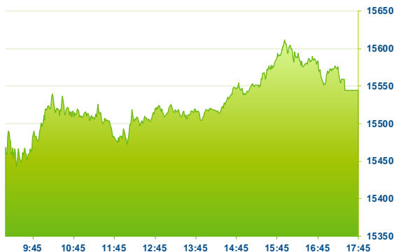
DAX (předchozí den)

Index DAX odepсал 0,52 % na 15559,37 b. Evropský akciový trh v pátek oslaboval. Za celý červenec si však celoevropský index Stoxx 600 připsal 2 % a roste tak šestý měsíc v řadě, což je nejdelsí růstová série od roku 2013. Šestý měsíc v řadě roste také německý index DAX. Největší ztrátu z německého indexu DAX zaznamenaly akcie Fresenius Medical Care (FME; -4,3 %) a Fresenius (FRE; -3,8 %), které ráno reportovaly výsledky za 2Q. Podrobnosti v ranní zprávě. V 11:00 reportoval také v USA a Německu obchodovaný výrobce plynů Linde (LIN; +2,8 %), jehož čísla naopak trh přijal pozitivně. Společnost ve 2Q dosáhla tržeb 7,58 mld. USD (očekávání: 7,39 mld. USD) a očištěného zisku na akcii 2,7 USD (průměrné očekávání: 2,53 USD, nejvyšší odhad: 2,67 USD). Zároveň zvýšila celoroční výhled zisku z 9,6-9,8 USD na akcii na rozmezí 10,1-10,3 USD, přičemž analytici čekali 9,94 USD.